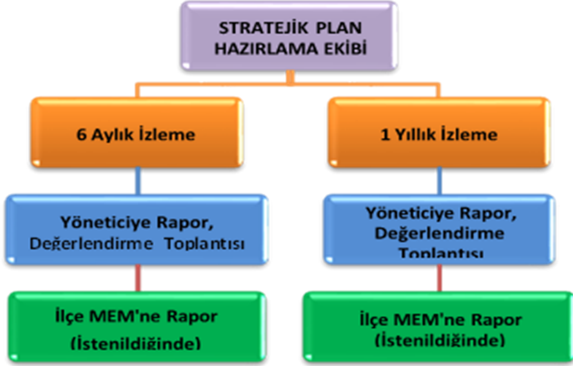
Şekil 3: İzleme ve Değerlendirme Süreci

Müdürlüğümüzün 2024-2028 Stratejik Planı İzleme ve Değerlendirme sürecini ifade eden İzleme ve Değerlendirme Modeli hazırlanmıştır. Müdürlüğümüzün Stratejik Plan İzleme- Değerlendirme çalışmaları eğitim-öğretim yılı çalışma takvimi de dikkate alınarak 6 aylık ve 1 yıllık sürelerde gerçekleştirilecektir. 6 aylık sürelerde rapor hazırlanacak ve değerlendirme toplantısı düzenlenecektir. İzleme-değerlendirme raporu, istenildiğinde İlçe Millî Eğitim Müdürlüğü'ne gönderilecektir. Ayrıca ilçemizin Mülki İdari Amirine sunulacaktır. 1 yıllık izleme-değerlendirme çalışmaları, Stratejik Planımızda yer alan hedeflerin yıllık düzeyde ifade edildiği Performans Programı ve yılsonunda gerçekleşme düzeylerinin belirlendiği Faaliyet Raporu hazırlanarak yapılacaktır.